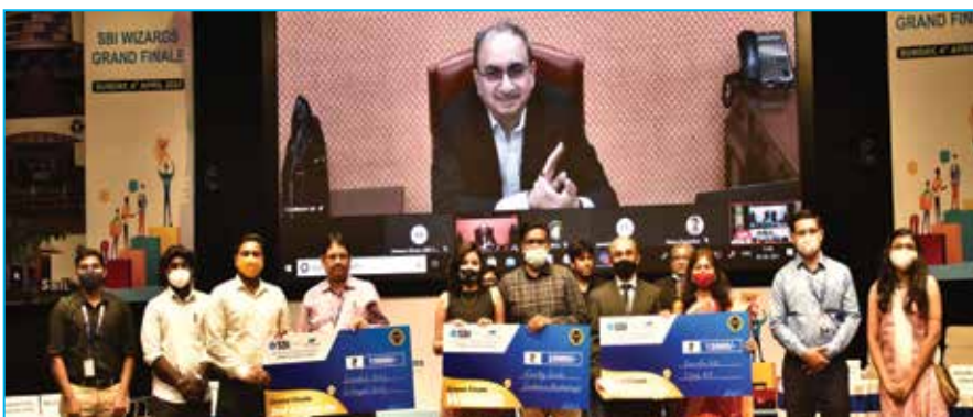
एसबीआई विज़र्ड: मुख्य कार्यक्रम एवं सूचना मेलर्स

i. सकारात्मकता को बढ़ावा देता "एसबीआई विज़र्ड" - एक ऑनलाइन प्रश्न मंच कार्यक्रम, "एसबीआई विज़र्ड" वित्त वर्ष 2020-21 में शुरू किया गया। यह प्रश्नमंच इतने बड़े स्तर पर अपने प्रकार की प्रथम पहल है। इसकी संरचना बहु पक्षीय है (आंशिक रूप से स्व गति आधारित, आंशिक रूप से ऑनलाइन तथा आंशिक रूप से भौतिक)। सकारात्मकता की थीम के अनुरूप कर्मचारी के एक परिवार के सदस्य को शामिल करने के लिए प्रतिभागी समूह को विस्तृत किया गया।